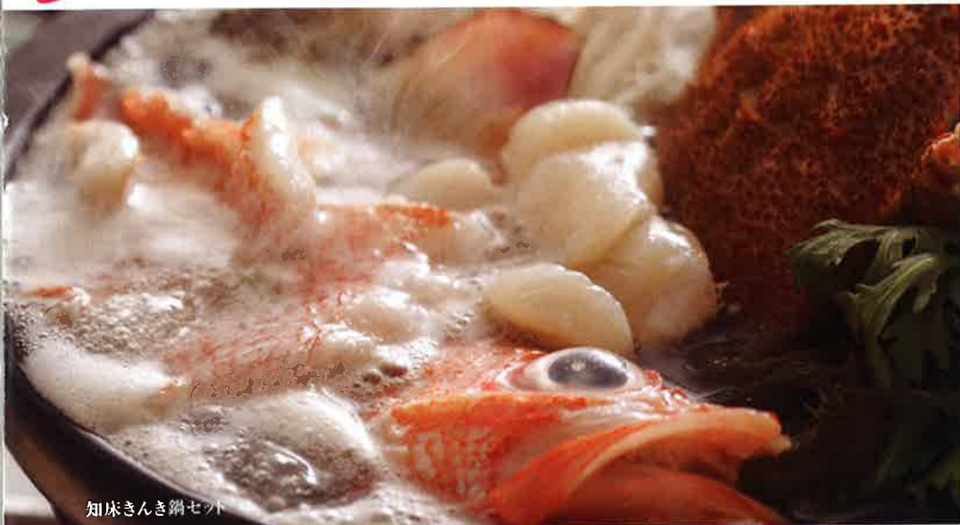
知床きんぎ網セウ