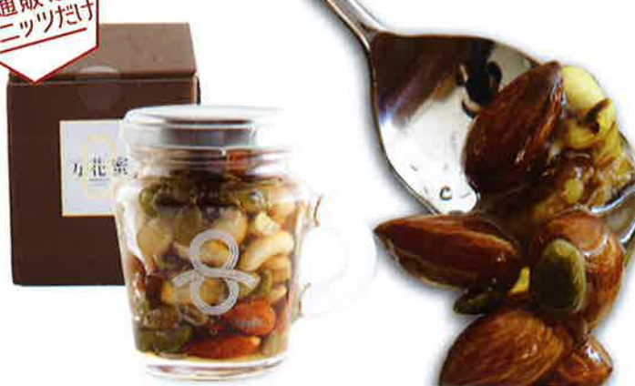
100%純国産で作られた万花蜜 & 厳選ナッツのコラボ！ [島根] <リセラファーム> ナッツの蜂蜜漬け 125g 翌日お届け便 1,404円(税込)