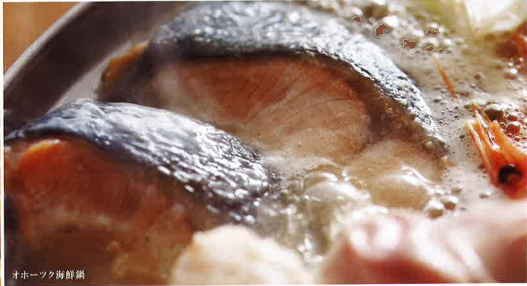
オホーツク海鮮鍋

北海道は厳しい冬の季節を迎えました。この時期に、オホーツク海を埋め尽くす流氷は、遠くシベリアのアムール川から、1000キロもの旅をしてこの地にたどりつきます。流氷が蓄える豊富なミネラルを求めたくさんのプランクトンが生まれ、それを目当てに集まった魚や蟹がおいしく育つ。流氷と大自然が育むオホーツクの恵みのサイクルを、私たちの食卓にもおすそ分けしてもらいましょう。