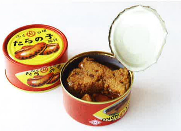
醤油の利いた甘辛の味付けがクセになる、ご飯やお酒にぴったり！ [石川] <金沢ふくら屋> たらの子缶詰 T2号缶 170g 翌日お届け便 556円(税込)