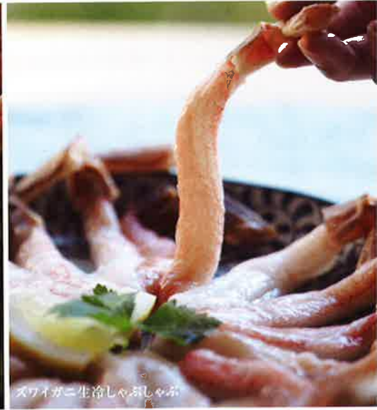
ズワイガニ生冷しゃぶ