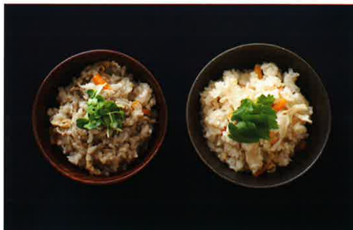
秋田華まいたけと比内地鶏の濃厚なスープで簡単絶品ごはん！ [秋田] <秋田十條化成> 炊き込みご飯の素(黒・白)各3食入 翌日お届け便 864円(税込)