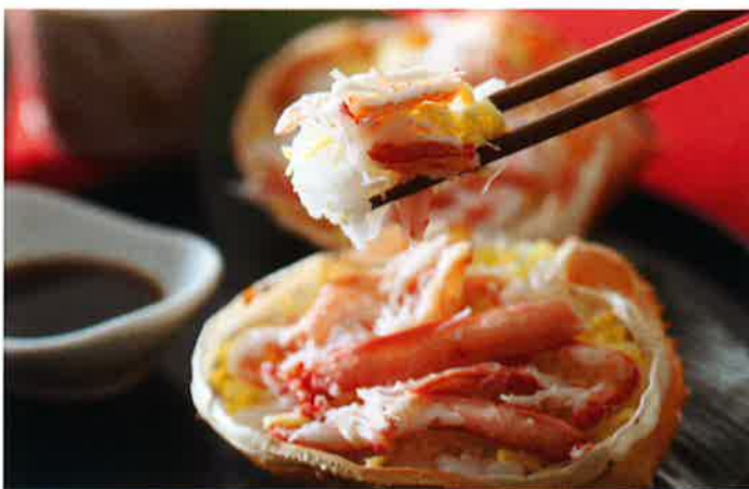
彩り鮮やか！紅ずわいがに ちらし寿司。おもてなしにも最適！ [鳥取] <小倉水産食品> かに甲羅ちらし寿司 110g×5個入 直送便(冷凍) 3,240円(税・送料込)