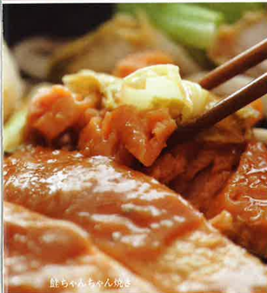
鮭ちゃんちゃん焼き