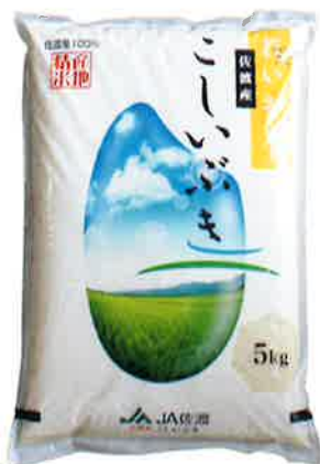
品質が良く、食味はコシヒカリ並の極良です！価格に自信あり！ [新潟] <コープ佐渡> 佐渡産こしいぶき 5kg 翌日お届け便 1,800円(税込)