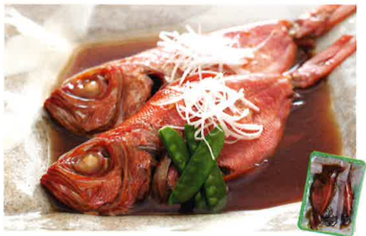
豪華なキンメの煮付けが温めるだけ！メニューに困ったらコレ！ [静岡] <伊豆急物産> 金目鯛煮付け 2尾(1尾約25~26cm) 直送便(冷凍) 2,358円(税・送料込)